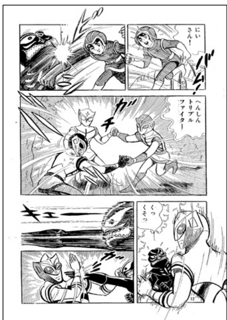
『トリプルファイター』講談社「テレビマガジン」掲載

2本ぐらいあると、5〜6人で1本を2日で終わらせないといけなかつた。徹夜明けでやることが多くて、終わったらみんな飲み会をやつてましたね。